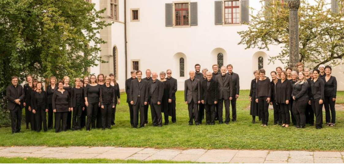
Klostergarten Wettingen