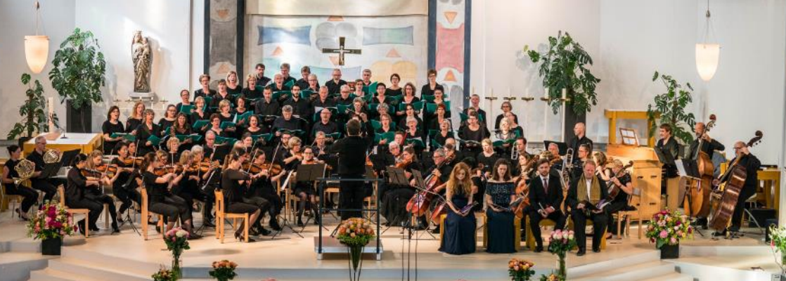
Jubiläumskonzert 2019, Kirche St. Anton