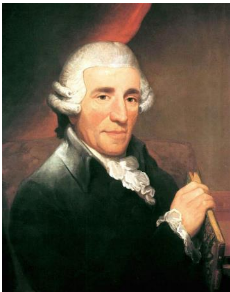
Joseph Haydn (1732-1809)