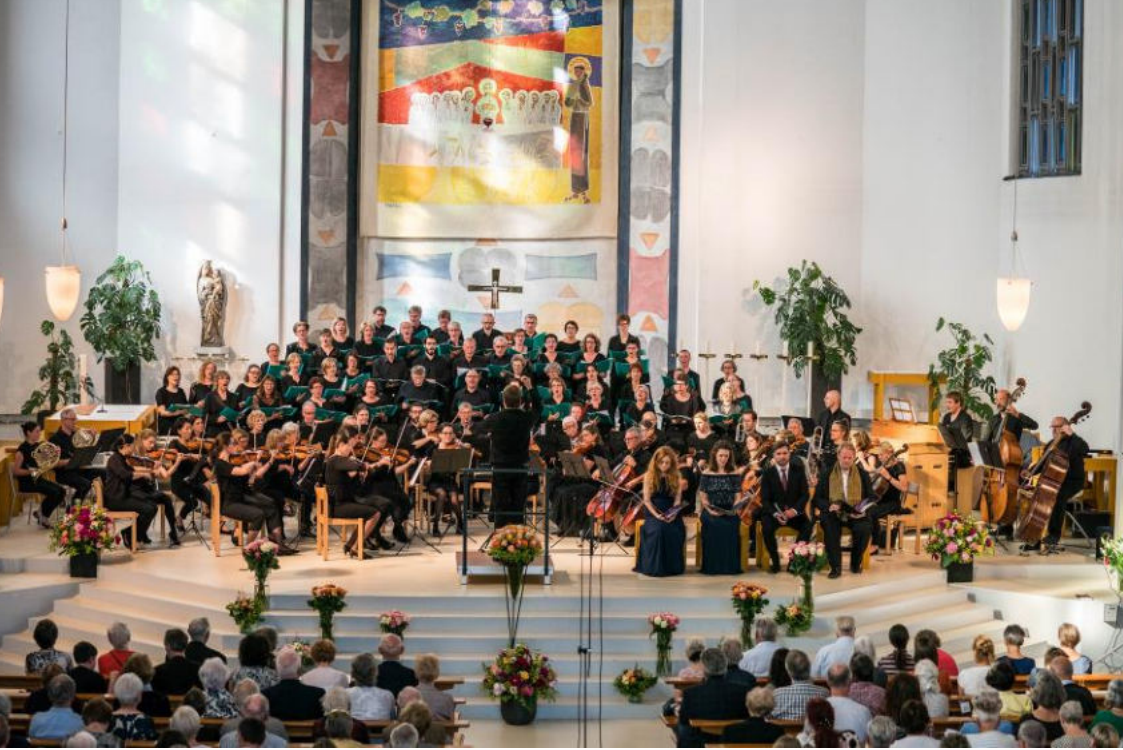
16. Juni 2019 - Jubiläumskonzert in Zusammenarbeit mit Sinfonia Baden, Kirche St. Anton