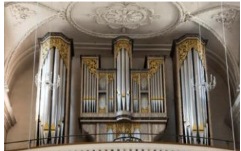
Orgel Stadtkirche Baden