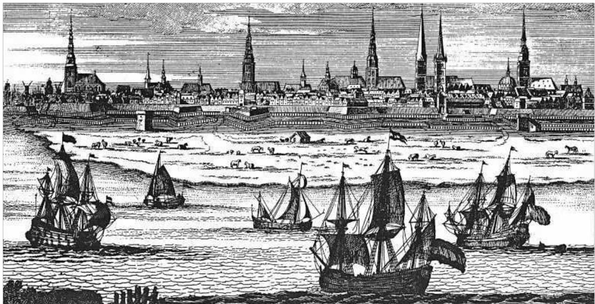
Hamburg um 1750