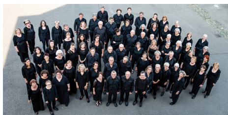
Schola Cantorum Wettingensis